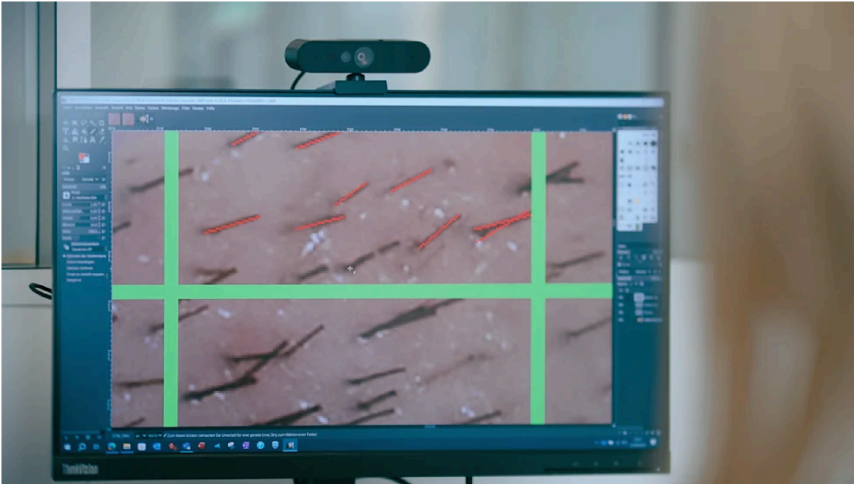
DMG-Studie: 10.000 Haare pro Person einzeln gezählt

DMG steigert deutlich die Zellaktivität in der Haarwurzel und bremst die Alterung geschwächter Zellen . Genau diese beiden Faktoren entscheiden darüber, ob Haare kräftig weiterwachsen – oder mit der Zeit an Stärke verlieren.